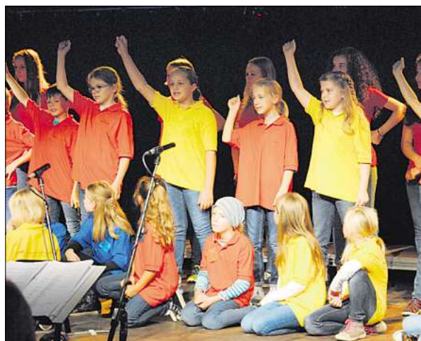
Sie stehen den Erwachsenen in nichts nach: Gemeinsam füllen die Ensemble-Spatzen und die Young Vocals am Sonntagnachmittag beim Familientag das Kulturzelt.