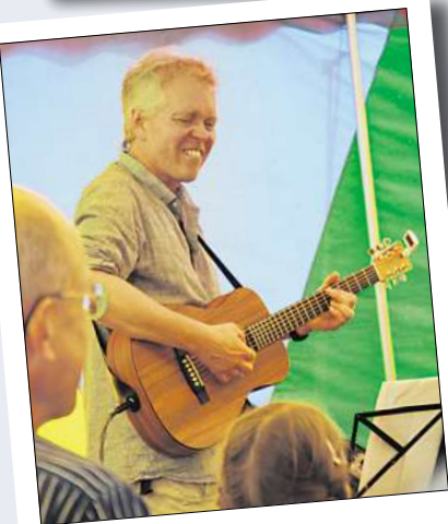
Die Musikschule Isernhagen und Burgwedel macht beim Familientag Lust auf Instrumente.